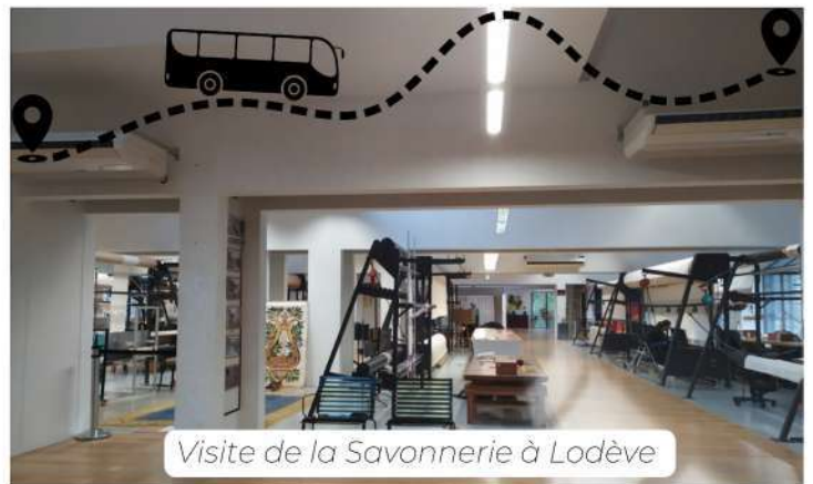
Visite de la Savonnerie à Lodève

Le principe est simple : un moment culturel (exposition, projection, festival...) vous fait envie alors pourquoi y aller seul/le dans votre voiture alors que nous sommes sans doute plusieurs à avoir la même envie ! Alors on propose, on s'organise et on remplit les voitures ! De plus, selon les organisateurs, cela permet de bénéficier des tarifs de groupe.