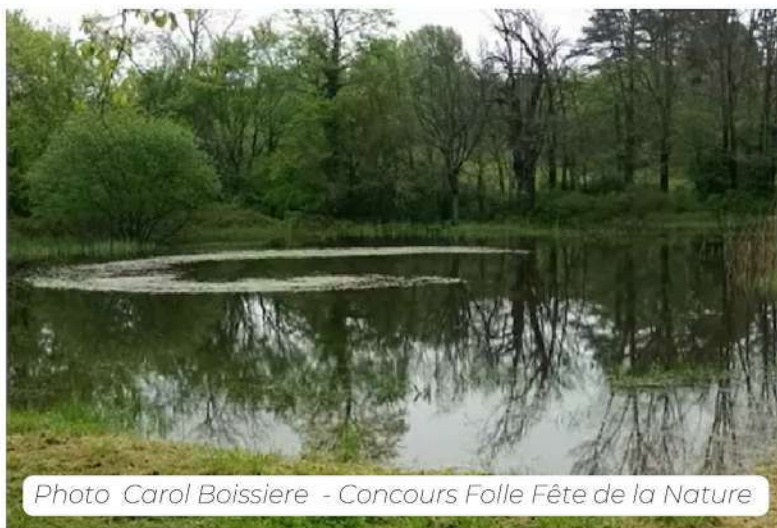
Concours Folle Fête de la Nature

Le Conservatoire des Espaces Naturels d'Occitanie a la charge de la préservation et de l'entretien des mares et lavognes du Causse du Larzac.