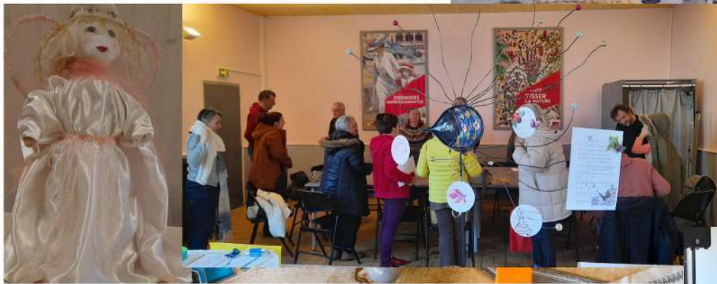
Pèle-Mèle : ateliers créatifs, concert Les Oiselles du Trottoir, séance jeux