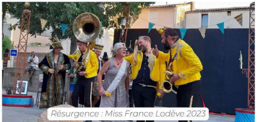
Résurgence : Miss France Lodève 2023

Venez avec vos idées ! à la Médiathèque / Tiers Lieu Georgette Milhau, Jeudi 11 Juillet à 18h30