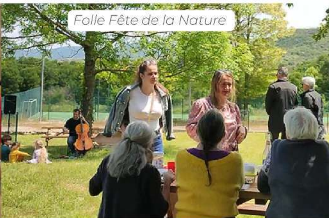
Folle Fête de la Nature