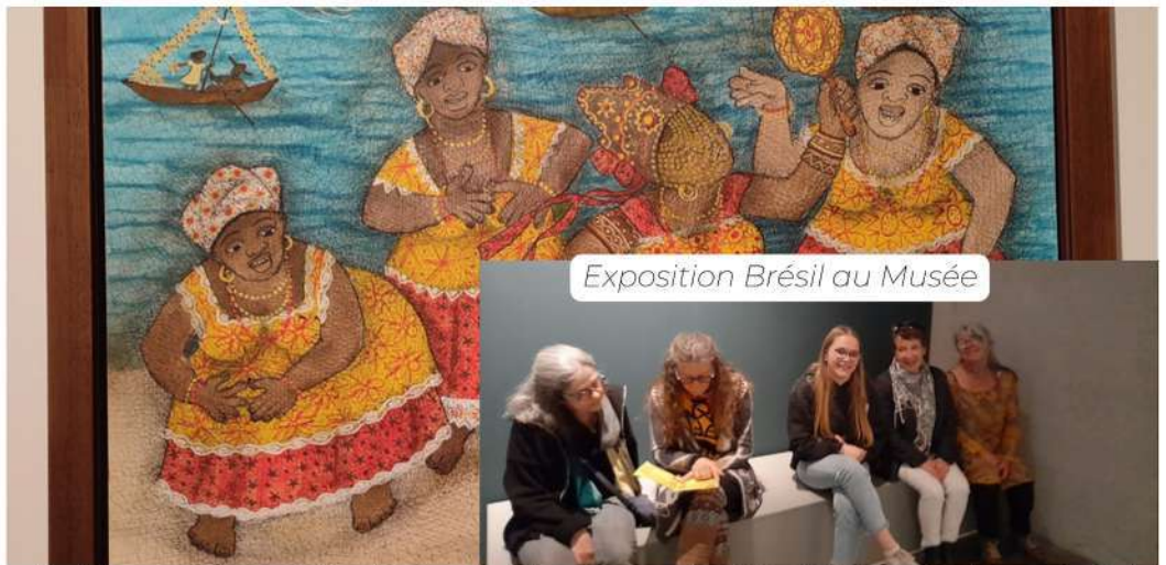
Exposition Brésil au Musée