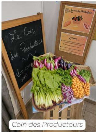
Coin des Producteurs

Vous êtes nombreux à profiter du service de retrait de commandes auprès de producteurs : 145 transactions en quelques mois !