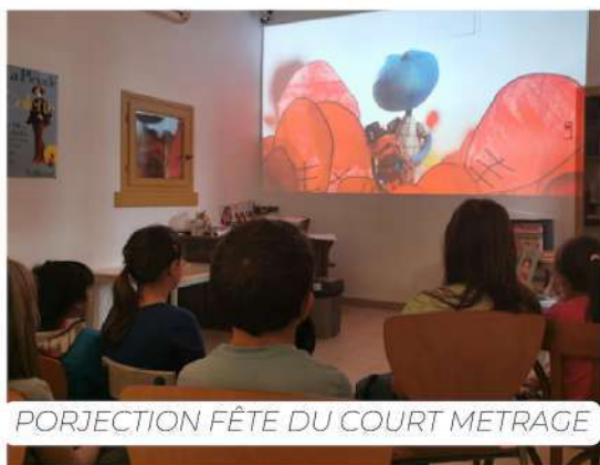
PORJECTION FÊTE DU COURT METRAGE