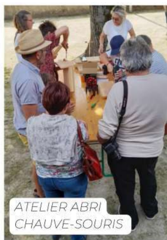
ATELIER ABRI CHAUVE-SOURIS

PETIT RAPPEL : L'INSCRIPTION À LA MÉDIATHÈQUE / TIERS LIEU GEORGETTE MILHAU EST GRATUITE POUR TOUS.