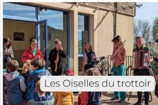
Les Oiselles du trottoir